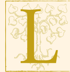
LANDGASTHOF ZUR LINDE SEIT 1609