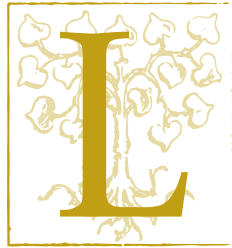
LANDHOTEL ZUR LINDE STEINHAUSEN