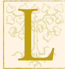
LANDGASTHOF ZUR LINDE SEIT 1609